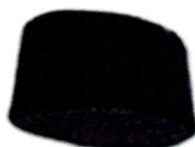
PECI WARNA HITAM POLOS BAHAN BELUDRU