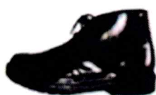
SEPATU WARNA HITAM POLOS